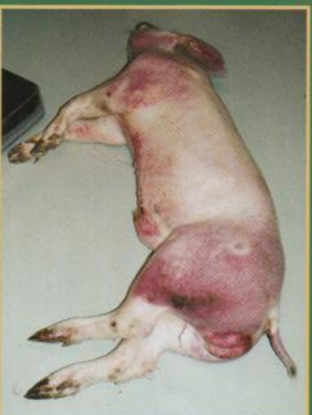
Krvavi proljev i crvenilo na koži vrata, grudni i nogu

ASK se manifestira različitim kliničkim znakovima. Zaražene, bolesne svinje uglavnom ugljaju. Obično se javlja gubitak apetita, ležanje i nevoljnost, a svinje brzo i iznenada uginu. Rijetko se pojavljuju drugi klinički znakovi: potištenost, gubitak tjelesne težine, krvarenja na koži (vrhovi uški, rep, noge, grudna i trbušna regija), otežano kretanje i pobačaji kрмаča. Klinički znakovi se teže uočavaju u divljih svinja.