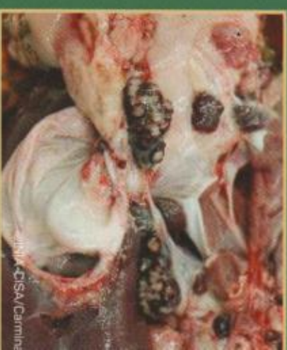
Krvavi limfni čvorovi