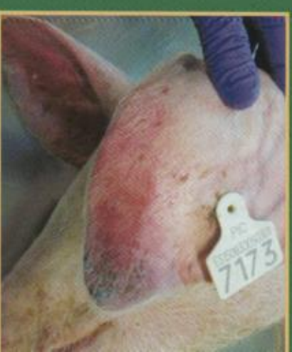
Cijanosa – plavo ljubičasta boja na vrhovima uški