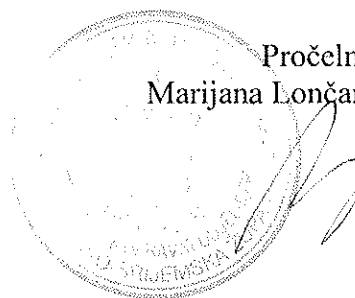
Pročelnica Marijana Lončar, dipl. oec.

O rezultatima javnog natječaja, kandidati će biti obaviješteni u zakonskom roku. Na web stranici Grada Iloka www.ilok.hr i na oglasnoj ploči Grada Iloka objavit će se vrijeme održavanja prethodne provjere znanja i sposobnosti kandidata, najmanje pet dana prije održavanja provjere.